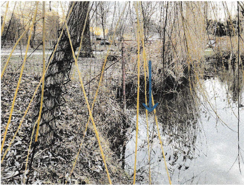
partél eredeti helye